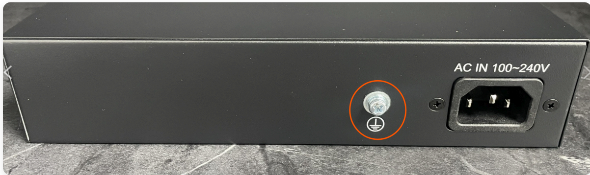
小型交換器規格表參考

小型交換器雖然有金屬外殼類型，但均無提供接地功能 如果產品支援機架安裝（例如 GS1016），則會提供接地螺絲孔（通常是三相電源供電的交換器）